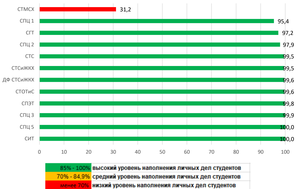
Рис. 2. Показатели заполнения личных дел студентов в АИС СГО