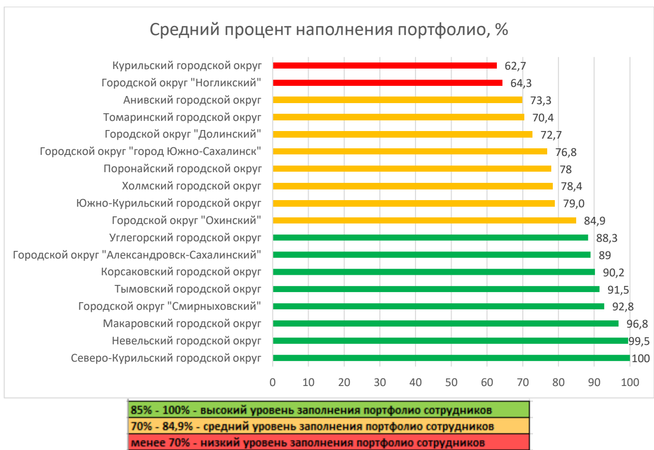
Рис. 2 Распределение муниципальных образований по показателю наполненности портфолио сотрудников ДОО в АИС СГО