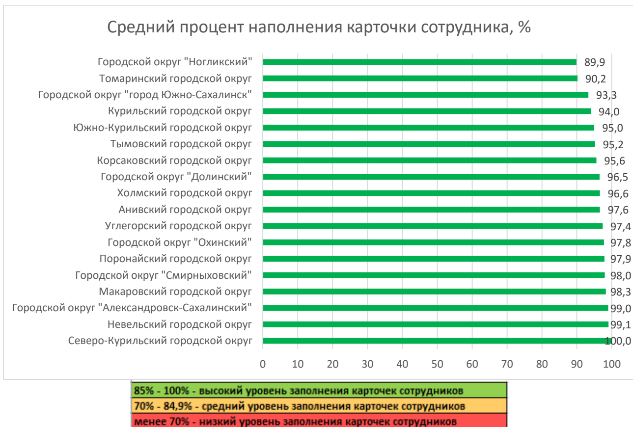
Рис. 1. Распределение муниципальных образований по показателю наполненности карточек сотрудников ДОО в АИС СГО