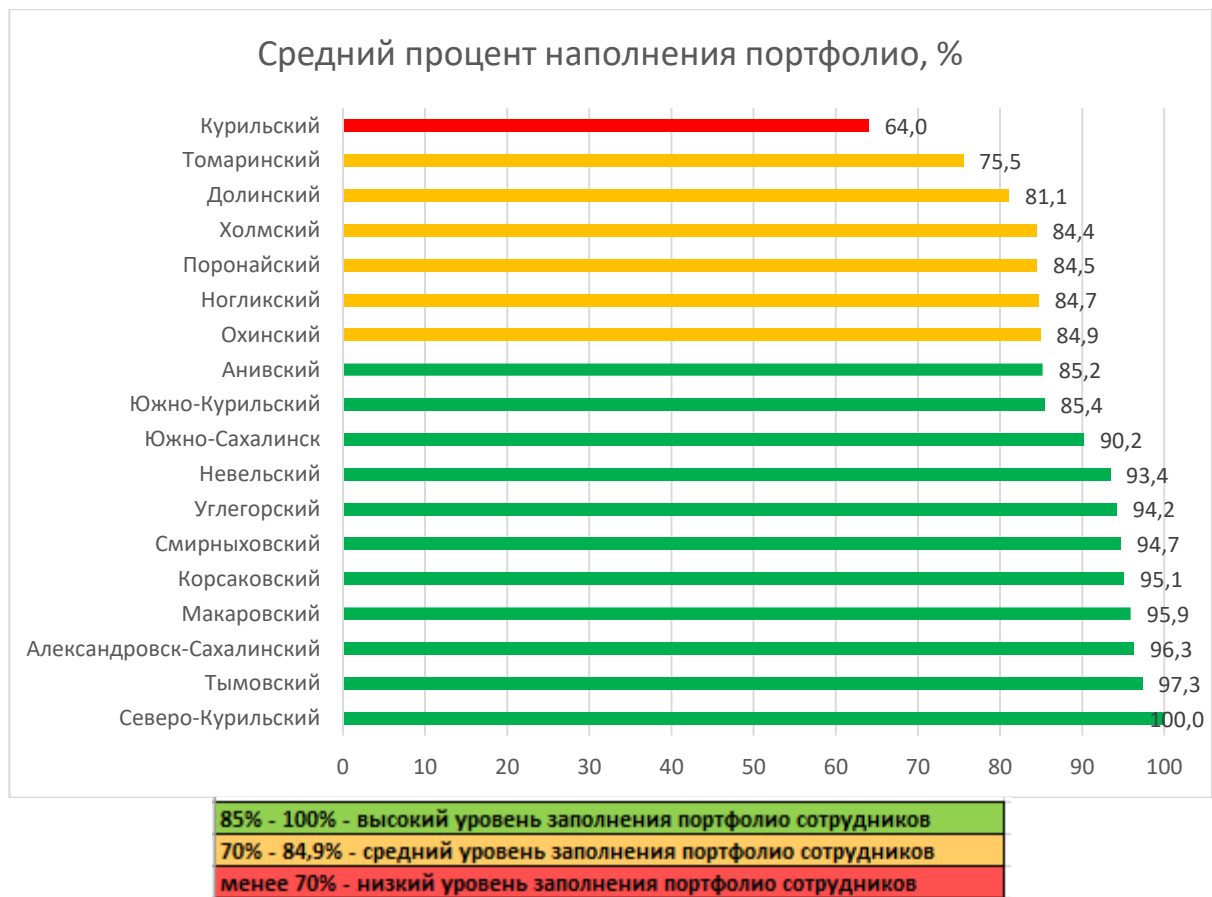
Рис. 2 Распределение муниципальных образований по показателю наполненности портфолио сотрудников ДОО в АИС СГО