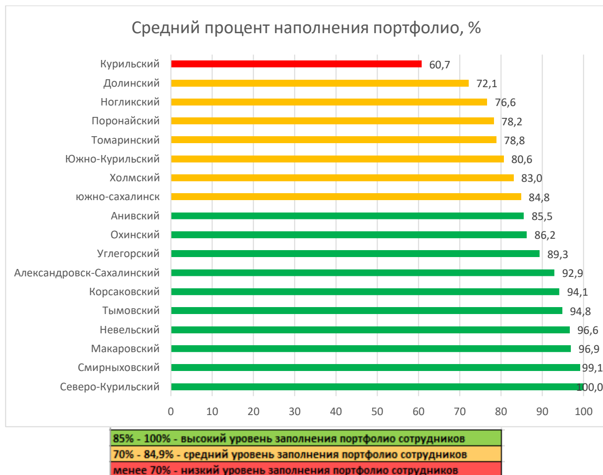
Рис. 2 Распределение муниципальных образований по показателю наполненности портфолио сотрудников ДОО в АИС СГО