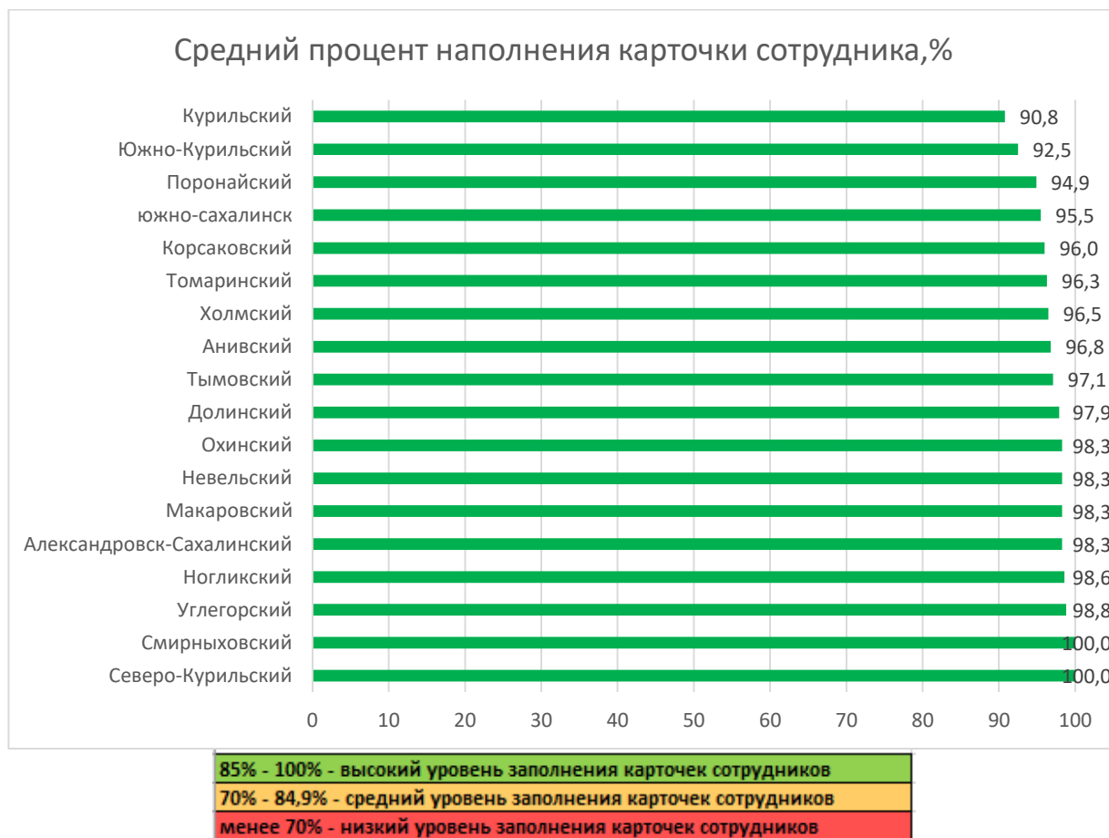
Рис. 1. Распределение муниципальных образований по показателю наполненности карточек сотрудников ДОО в АИС СГО