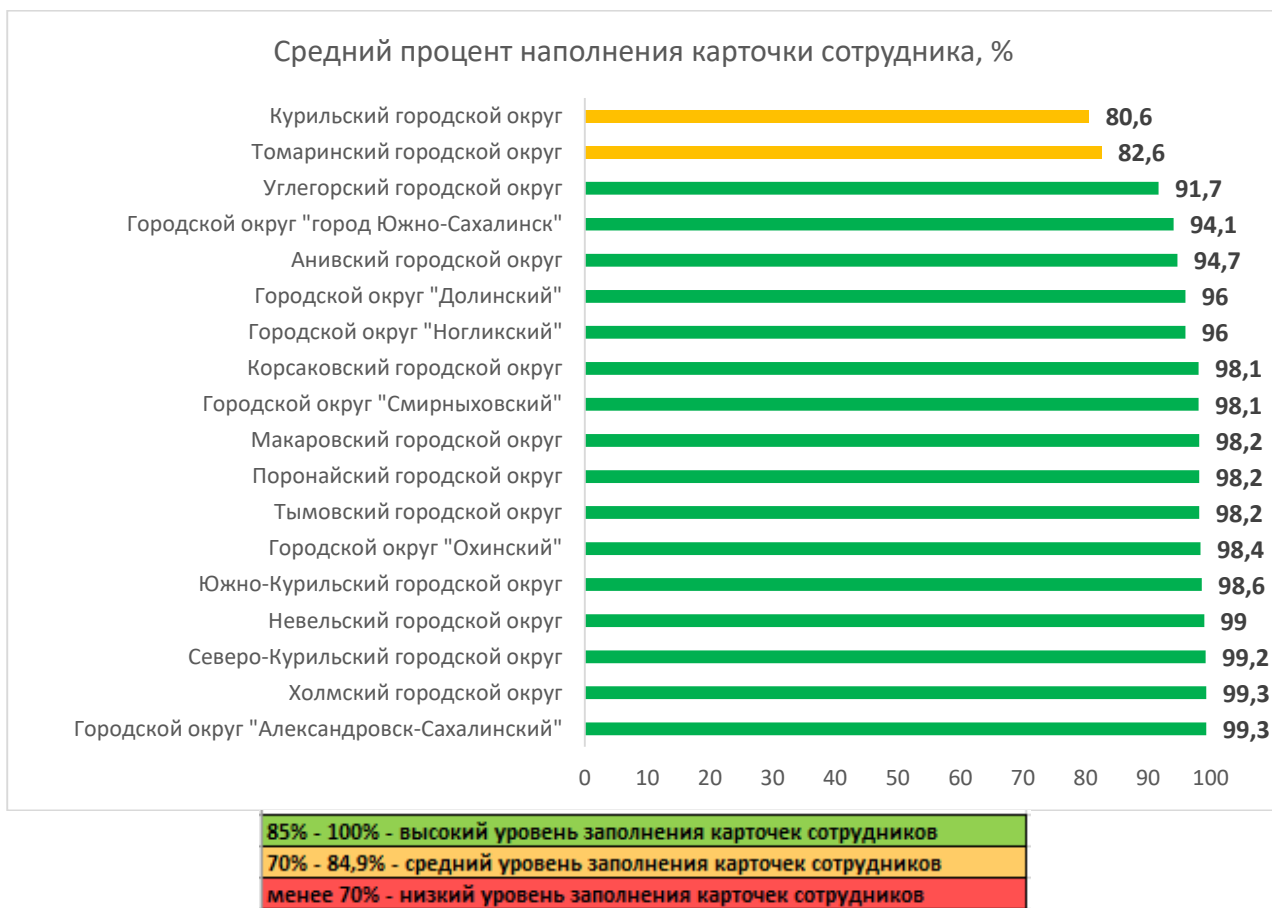
Рис. 1. Распределение муниципальных образований по показателю наполненности карточек сотрудников ДОО в АИС СГО