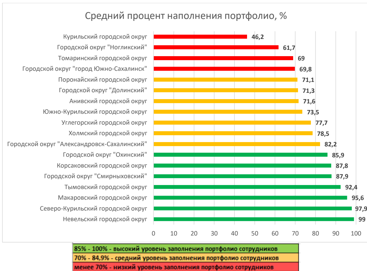
Рис. 2 Распределение муниципальных образований по показателю наполненности портфолио сотрудников ДОО в АИС СГО