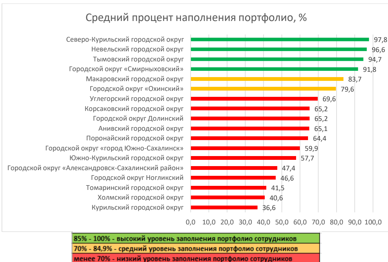
Рис. 2. Распределение муниципальных образований по проценту заполнения портфолио сотрудников в АИС СГО