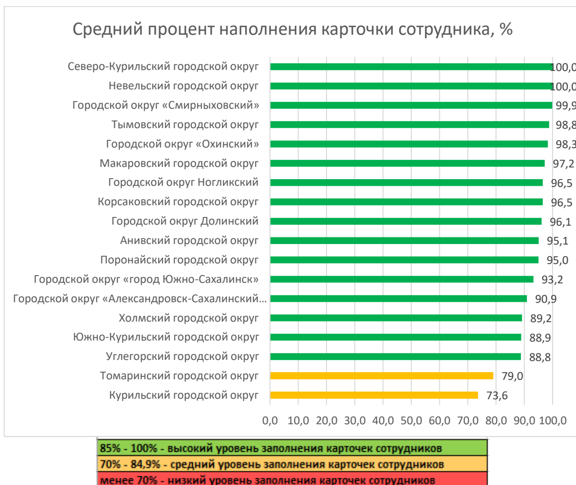
Рис. 1. Распределение муниципальных образований по проценту заполнения карточек сотрудников в АИС СГО